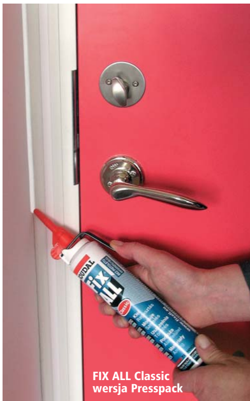
FIX ALL Classic wersja Presspack