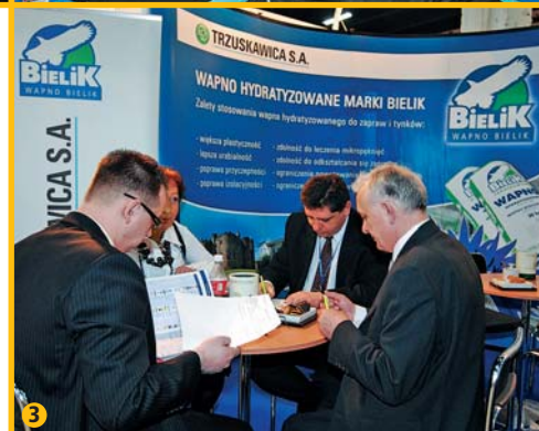
Rozmowy i podpisywanie kontraktów.