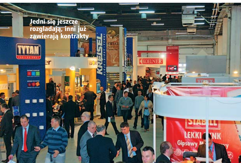
Jedni się jeszcze rozglądają, inni już zawierają kontrakty