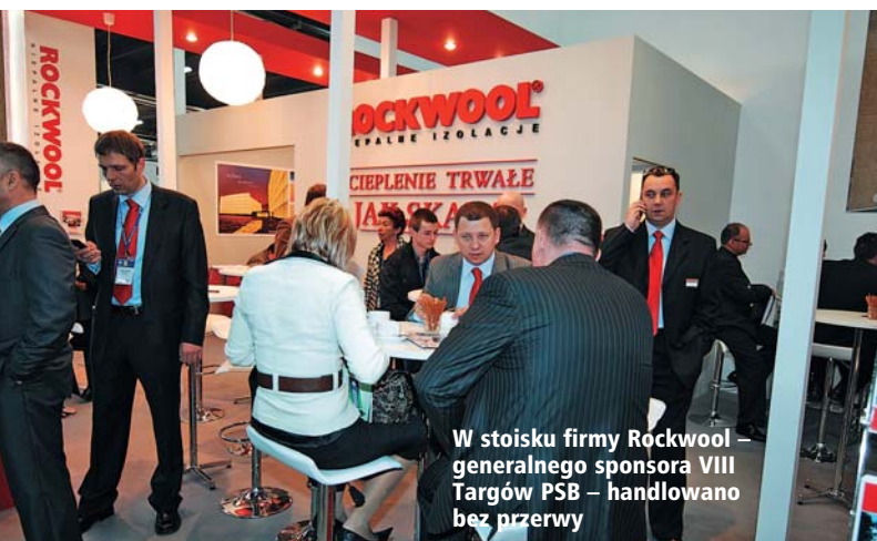
W stoisku firmy Rockwool – generalnego sponsora VIII Targów PSB – handlowano bez przerwy

Po raz kolejny Targi PSB, organizowane w kwietniu w Kielcach, przyniosły rekordową liczbę kontraktów o rekordowej wartości.