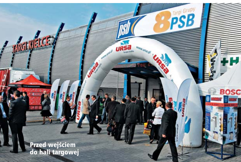
Przed wejściem do hali targowej